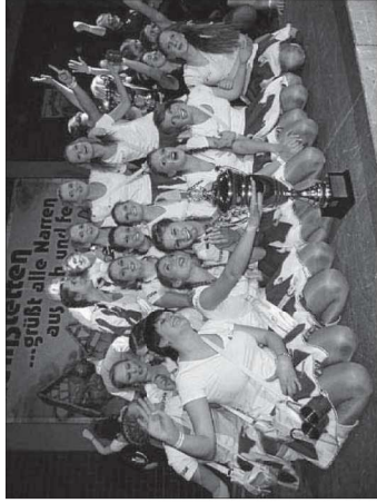
Die Spaichinger Prinzengarde schafft es wieder auf den ersten Platz!

Im Showteil belegte die Showtanzgruppe aus Wallendingen den 1. Platz. Die Prinzengarde Spaichingen belegte zum sechsten Mal in Folge den 2. Platz, gefolgt von Dotternhausen Forever Young auf dem 3. Platz.